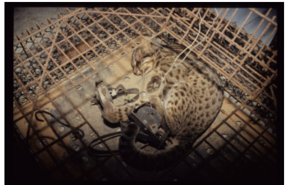
▲圖6、1996年送至特生中心野生動物急救站的石虎，因為到雞舍偷吃雞而被獸銜夾傷，但傷重不治當晚死亡。

自1994年至今共接獲21起石虎遭獸銜夾傷或死亡的案例（圖6）。裴家騏等人（2014）及高嘉孜（2013）的研究亦發現，苗栗地區的石虎狩獵壓力仍存在，動機以「危害防治」為主，顯示石虎的危害防治及非法狩獵為亟需解決的問題。