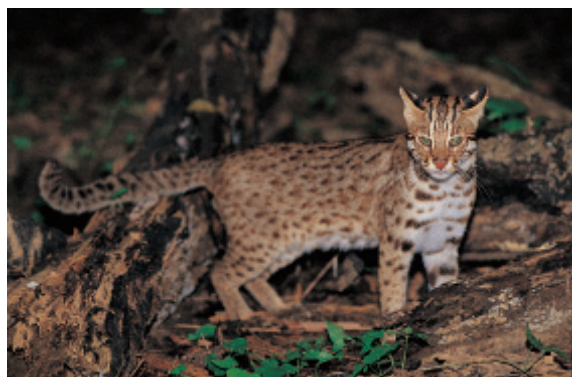
▲圖3、石虎身上有銹褐色塊斑

臺灣最早的石虎紀錄為英國博物學家 Swinhoe (1870) 的文章裡提到他取得骨頭、毛皮標本及活體。