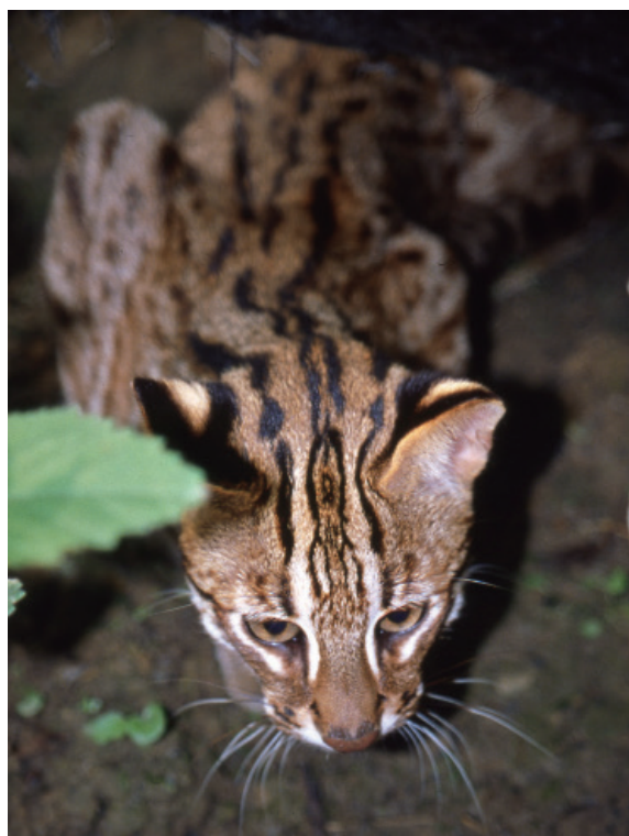
▲圖2、石虎耳後的黑底白斑十分明顯，是最易判斷和其他貓不同的特徵。