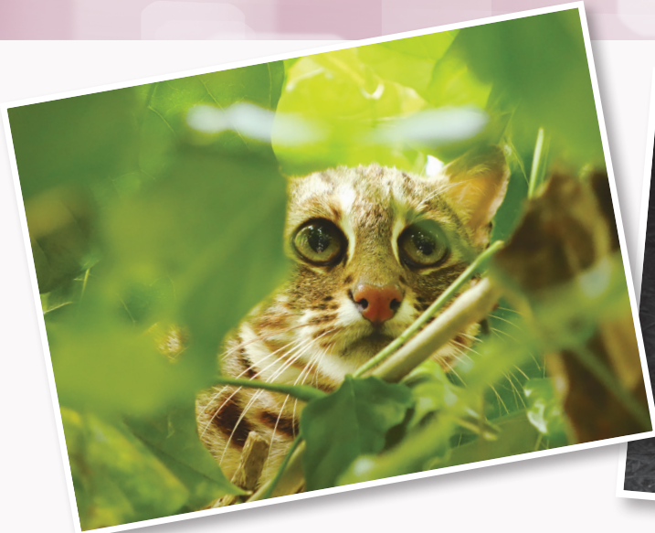
石虎是相當神祕的生物