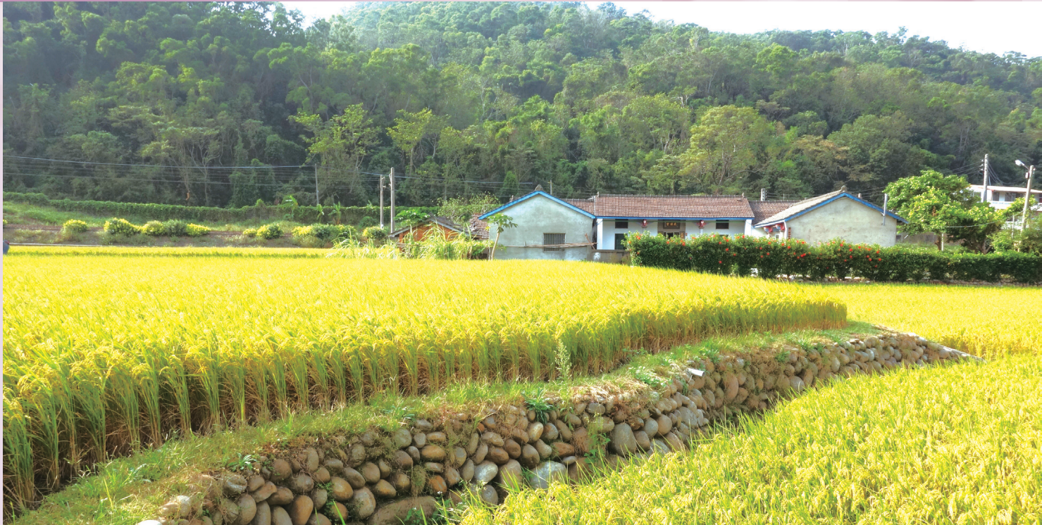
苗栗地區保有非常豐富的淺山生態系

衝突勢不可免。放眼全台的淺山區域，尤其是西部地區，都不可避免地遭到大面積的開發破壞，對於原本生存於此的野生動物，每進行一件開發案，就減少一片棲地。以目前石虎數量最多的苗栗地區來說，近十年來大大小小的開發案不斷，讓石虎的處境逐漸惡化。