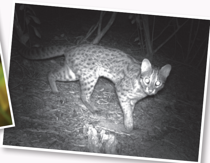
透過紅外線自動相機拍攝到的野生石虎