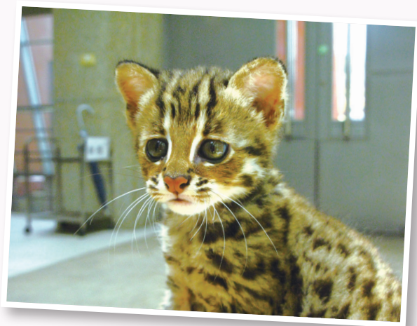
石虎可愛的模樣讓牠成為寵物市場覬覦的對象

從日治時期的全台普遍分布到現今只剩 500 隻，這段期間剛好是台灣農地開始大量使用農藥化肥的時期。特別是在民國