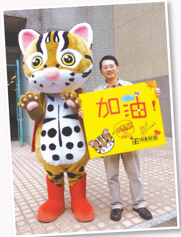
特有生物研究保育中心的阿虎人偶是石虎保育大使

位於南投集集的特有生物研究保育中心在推動石虎保育上也不遺餘力，研究人員抽絲剝繭地讓石虎的生態祕密逐一地展現出來。除了研究外，特有生物研究保育中心也投入石虎的解說教育工作，還製作了一套名為「阿虎」的石虎人型偶裝。每當有宣導活動時，阿虎便會出場擔任石虎保育大使，每每成功地吸引了群眾的目光，達到良好的宣導效果。2013年該中心拍攝的石虎紀錄片〈大地的孩子—小石虎返家之路〉，更獲得休士頓影展最高榮譽白金獎的肯定，讓國際都能見到台灣在石虎保育上的努力。