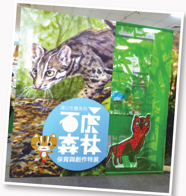
由藝術創作者們發起的石虎森林特展

有天他發現這塊田裡竟然有石虎出沒，為此他興奮不已。他告訴筆者說：雖然龍貓是虛構的生物，但這樣的淺山美景是真實的，而優遊在這片山林裡的石虎就是台灣人的龍貓！牠需要我們的關心、需要我們的愛護，讓我們齊心為石虎保育而努力吧！天祐石虎 永遠幸福！