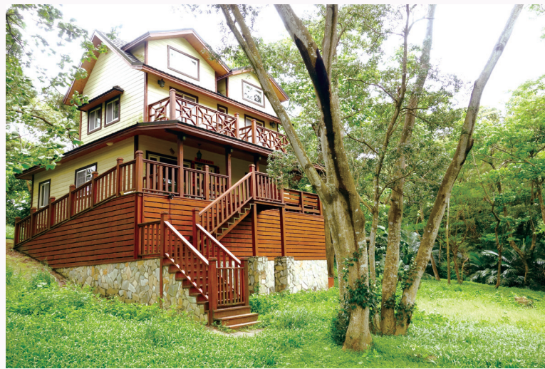
淺山裡的豪華農舍占據了石虎的棲地

令人擔憂的還有近年來在淺山地區刮起的農舍風！近年來這樣的農舍案就像雨後春筍般不斷冒出，大塊大塊地吞噬掉所剩不多